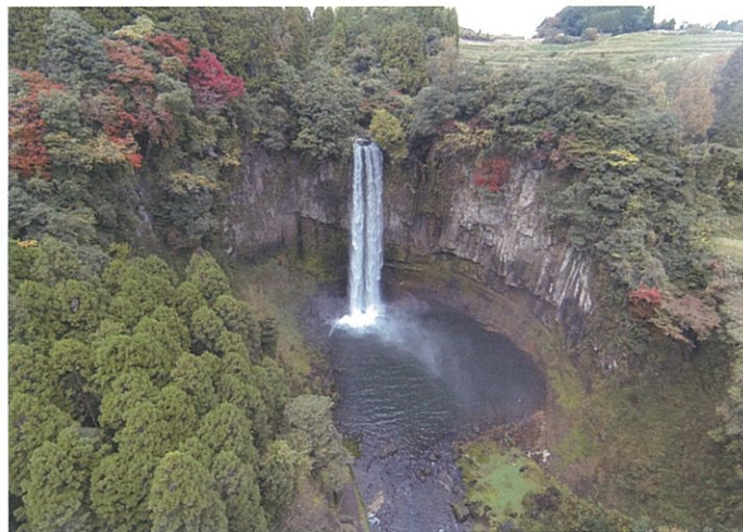
ドローンで撮影した五老ヶ滝