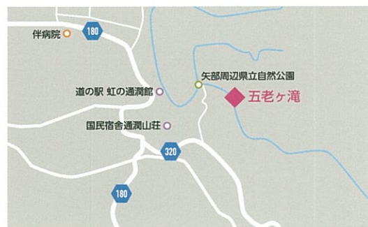
所在地：熊本県上益城郡山都町長原